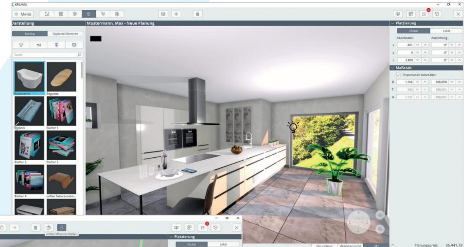
Edita la iluminación en tiempo real